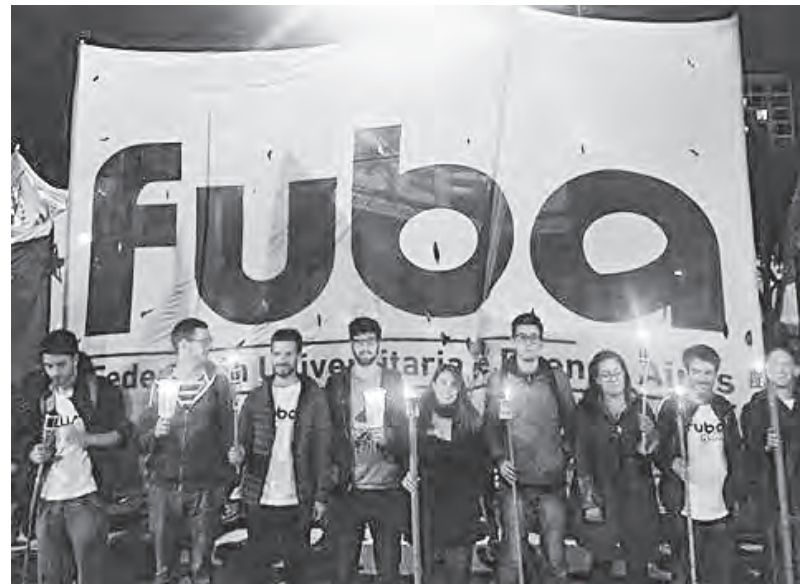
Federación Universitaria de Buenos Aires

Los días 19 y 20 sesionó el Congreso de la Federación Universitaria de Buenos Aires en paneles y asambleas por Facultad. El 21 una Asamblea Interfacultades resolvió un plan de lucha.