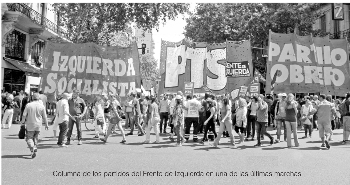
Columna de los partidos del Frente de Izquierda en una de las últimas marchas

El 24° Congreso del PO adoptó como eje el llamado a “Congreso del movimiento obrero y la izquierda convocado por el Frente de Izquierda” (Carta a los partidos del FIT). Desde nuestro punto de vista es una propuesta equivocada. Ya que ni ayuda a la unidad del sindicalismo combativo ni soluciona la crisis del FIT por la propuesta divisionista del PTS de ir a un enfrentamiento en las PASO por la candidatura de Del