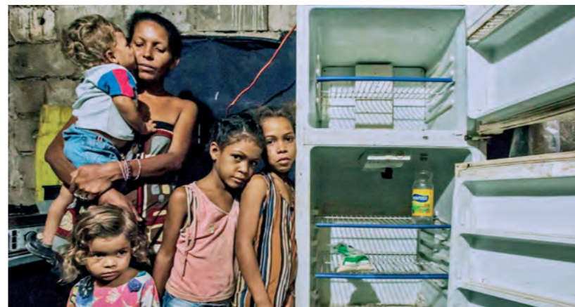
El ajuste capitalista de Maduro condena a millones al hambre

Para justificar la represión, Maduro tilda de “mercenarios del imperialismo” a centenares de miles que se movilizan. Es un síntoma de la desesperación del gobierno. Si bien Estados Unidos ha tenido roces diplomáticos con Maduro, sobre todo en la OEA donde presiona por la realización de elecciones, hasta el momento no ha estado a favor de