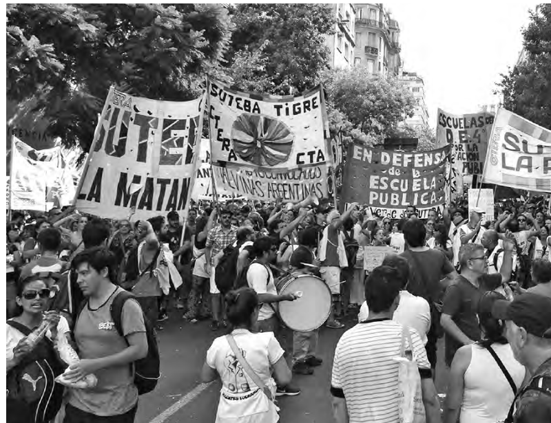
Los Sutebas multicolores en marcha docente

Vidal nos está maltratando, ofrece miseria en cuotas, en negro, por tres años, plantea la destrucción del régimen de licencias, del estatuto, pago por meritocracia, presentismo.