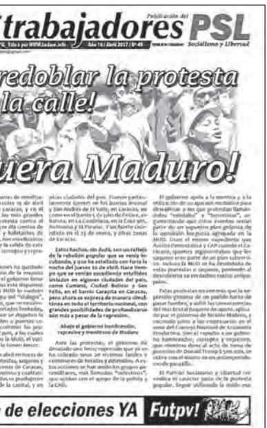
Volante del PSL, 23 de abril

“Proponemos realizar plenarios obreros y sindicales regio-