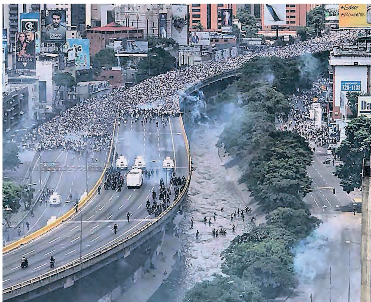
La represión del 19 de abril obligó a manifestantes a lanzarse al contaminado Río Guaire en Caracas

Luego de perder las elecciones parlamentarias en 2015, el gobierno ha optado por suspender indefinidamente todas las elecciones y retiró de la legalidad electoral a la mayoría de los partidos políticos. Desde 2014 el gobierno también impide la realización de elecciones sindicales, como en la Federación Unitaria de Trabajadores Petroleros de Venezuela (Futpv), cuyo secretario general es José Bodas del Partido Socialismo y Libertad (PSL). A fines de marzo, el Tribunal Supremo de Justicia (TSJ) autorizó al presidente a reformar la ley antiterrorista, la ley contra la corrupción, el código penal, el código de justicia militar, la ley de hidrocarburos y a constituir empresas mixtas con transnacionales petroleras sin aprobación parlamentaria. La fiscal general, Luisa Ortega Díaz, denunció los fallos del TSJ como inconstitucionales, evidenciando una división en el gobierno. Maduro ordenó al TSJ modificar sus sentencias, lo que ocurrió a las pocas horas, pero ya la maniobra había generado un inmenso repudio en la población. La MUD, que venía favoreciendo una línea de negociación con Maduro por la mediación de El Vaticano,