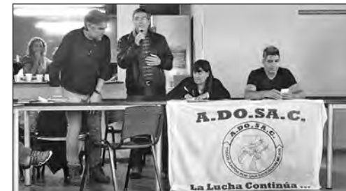
En la asamblea provincial de Adosac