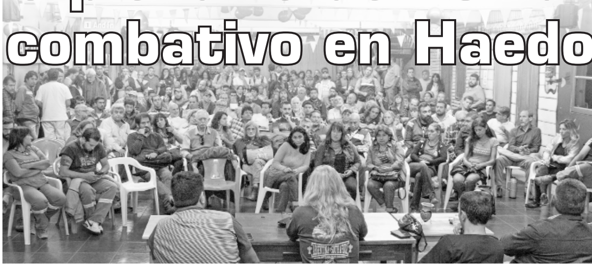
Vista del plenario

El sindicalismo combativo se reunió nuevamente en un plenario para discutir cómo avanzar hacia una coordinación que luche contra el ajuste de Macri y los gobernadores y se postule ante la tregua que mantiene la burocracia con el gobierno.